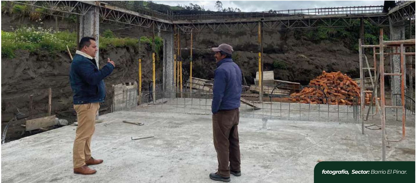
fotografía, Sector: Barrio El Pinar.