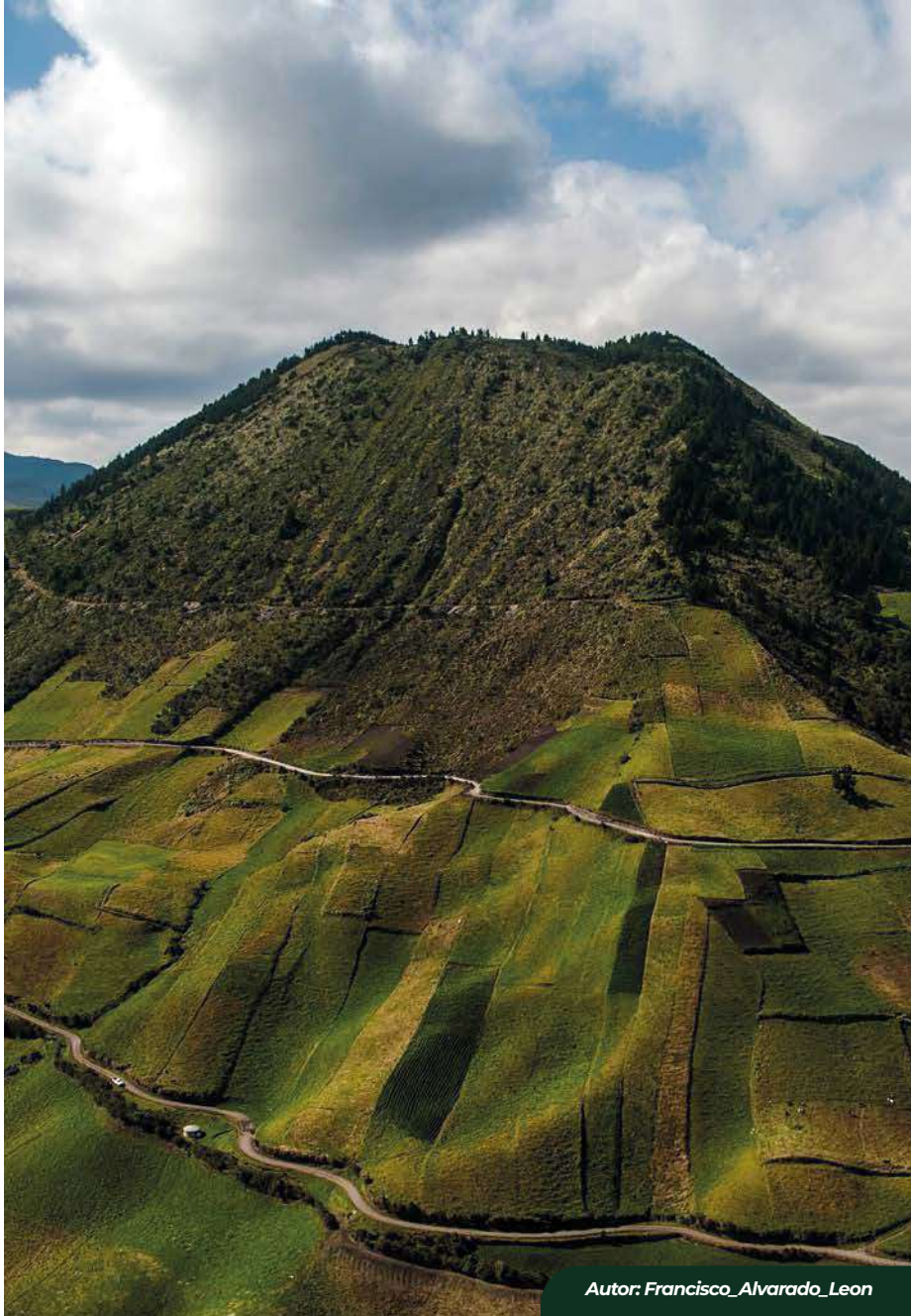
Autor: Francisco Alvarado Leon

El nombre "Puñalica" proviene de la palabra quechua "puna", que significa "páramo", y "lica", que significa "punta"